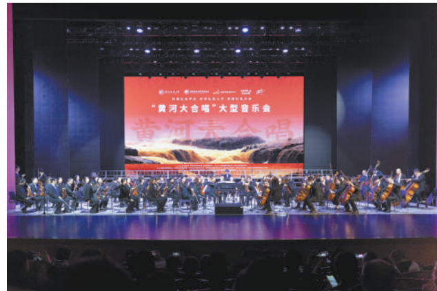
举行《黄河大合唱》专场音乐会

学校以人才培养为核心,以学科建设为牵引,以平台建设为载体,不断充实教学内容、创新教学方式,扎实推进党的创新理论进教材、进课堂、进头脑。建强思政课主渠道,开设《党史教育》《习近平法治思想概论》《陕甘宁边区法制史》《中华法治文明》等特色课程,以及《马克思主义的时代解读》《习近平总书记教育的重要论述研究》等通识选修课程,4门思政课程列入学校金课建设,持续推动习近平新时代中国特色社会主义思想、习近平法治思想和党的二十大精神有机融入、全面贯彻哲学社会科学各学科知识体系。