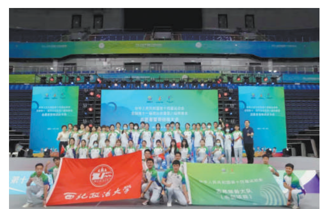
参加志愿服务活动

站在“两个一百年”奋斗目标历史交汇的关键节点,西法大师生将深入学习贯彻习近平总书记关于教育的重要论述,把立德树人的成效作为检验一切工作的根本标准,将思政“小课堂”融入社会“大课堂”,努力培养堪当民族复兴大任的时代新人。(党委宣传部 张俊)