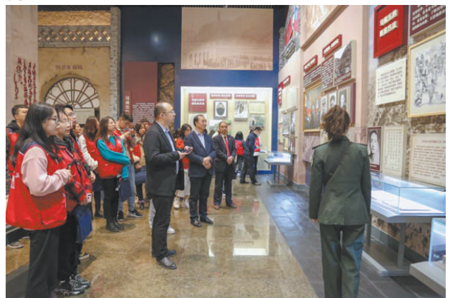
本硕博一体化的“红色法治研习之旅”

认真落实校领导听课思政制度。学校党委书记、校长带头进课堂,带头联系思政课教师,带头推动各类课程与思政课同向同行,为形成“大思政课”一体化育人格局按下“加速键”。