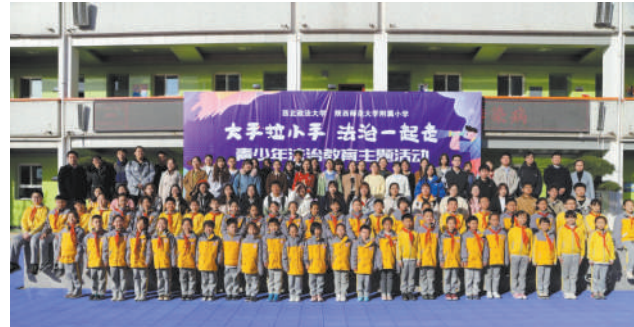
开展青少年法治教育主题活动

学校深入落实教育部等十部门印发的《全面推进“大思政课”建设的工作方案》要求,全面深化思政课教学守正创新,构建全面覆盖、类型丰富、层次递进、相互支撑的课程思政体系。成立“课程思政研究中心”,探索“行走的思政课”“师生同台”“专题+艺术”“实践研修+现场教学”等教学新模式,打造课程思政“一院一品”项目,组织本硕博一体化的“红色法治研习之旅”,开展“开学第一课”“教学名师第一课”“上好新生第一课”等特色思政活动,“引导学生扣好人生第一粒扣子”。