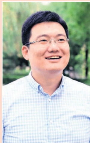
有人说,优秀的学者不一定是优秀的教师,即使一个人博学多才,也并不代表他能够将知识悉数传授于学生。

及人格与人格权领域,发表多篇学术论文,出版个人专著《自然人的法律构造》《人格权的理论基础及其立法体例》和《非法人团体的事实属性与规范属性》,在物权法领域有着极深造诣。