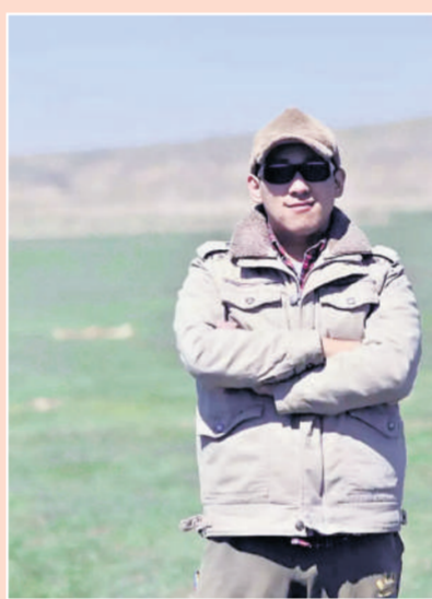
步洋洋老师以古今贤者之言为准则,身体力行,实修精进。