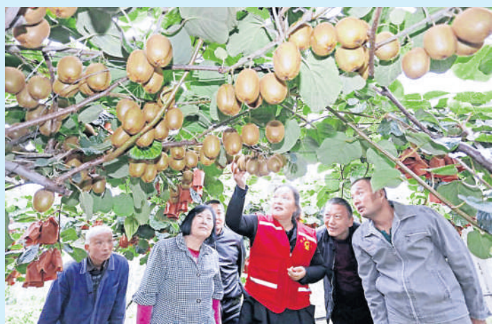
学校邀请专家现场指导果农猕猴桃种植技术

金秋十月,秦东大地丹桂飘香,零河两岸硕果累累。在渭南市临渭区三张镇铁王村的猕猴桃产业基地,果香四溢的猕猴桃挂满枝头,收购的大货车停在路边,村民们忙的汗流浹背,却打